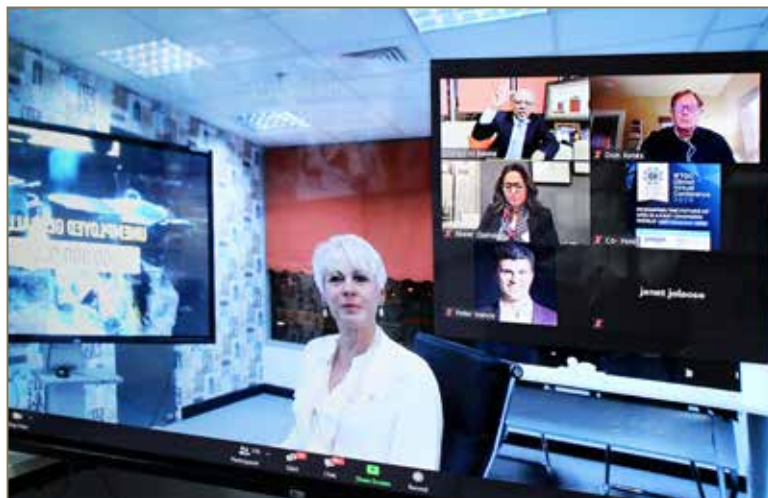
Snapshots of the IFTDO Annual Global Virtual Conference 2020