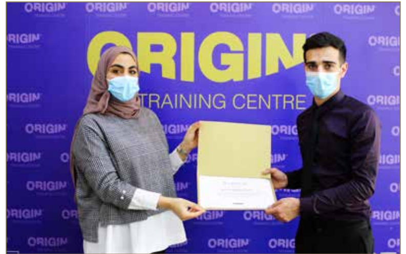
تكريم أحد المتدربين في برامج مركز أوريجين للتدريب