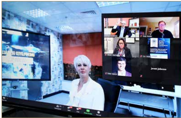
مقتطفات من أعمال مؤتمر منظمات التدريب IFTDO السنوي