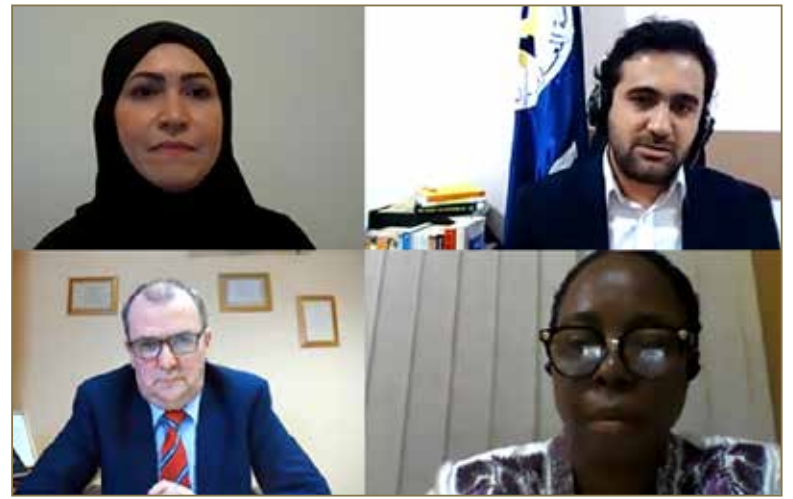
مقتطفات من أعمال مؤتمر منظمات التدريب IFTDO السنوي