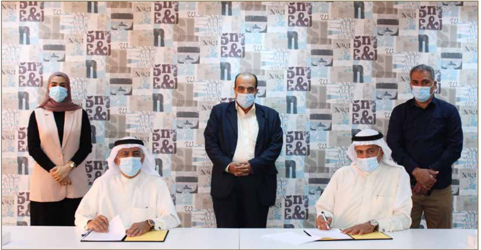
صورة لتوقيع الاتفاقية

الجمعية الأهلية لدعم التعليم والتدريب THE NATIONAL SOCIETY FOR THE SUPPORT OF EDUCATION & TRAINING