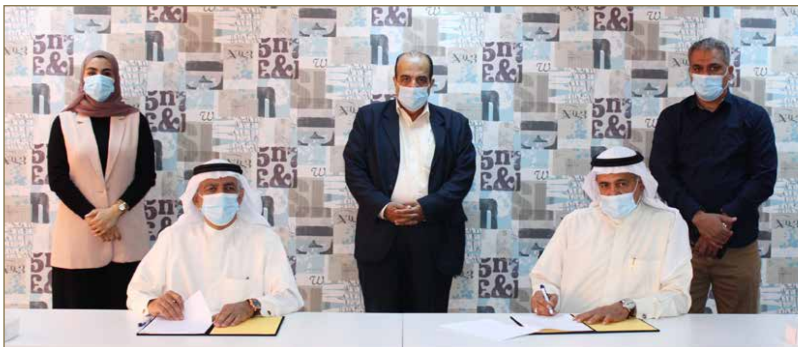
Photo of the signing of the agreement

signs an MOU to implement the Parents' Forum for Special Needs Students