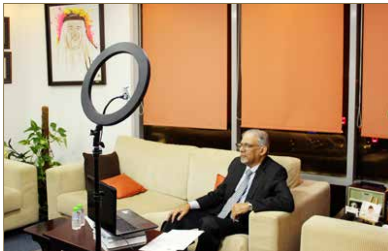
مقتطفات من أعمال مؤتمر منظمات التدريب IFTDO السنوي