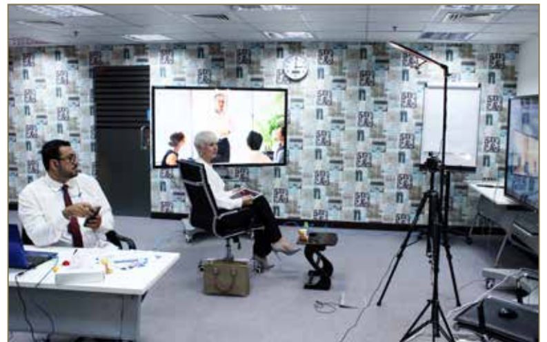
مقتطفات من أعمال مؤتمر منظمات التدريب IFTDO السنوي