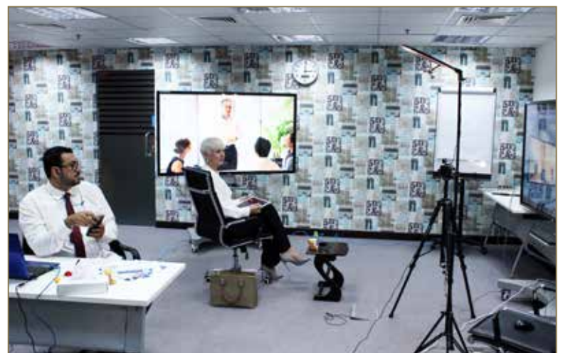
From the operations room of the IFTDO Virtual Conference