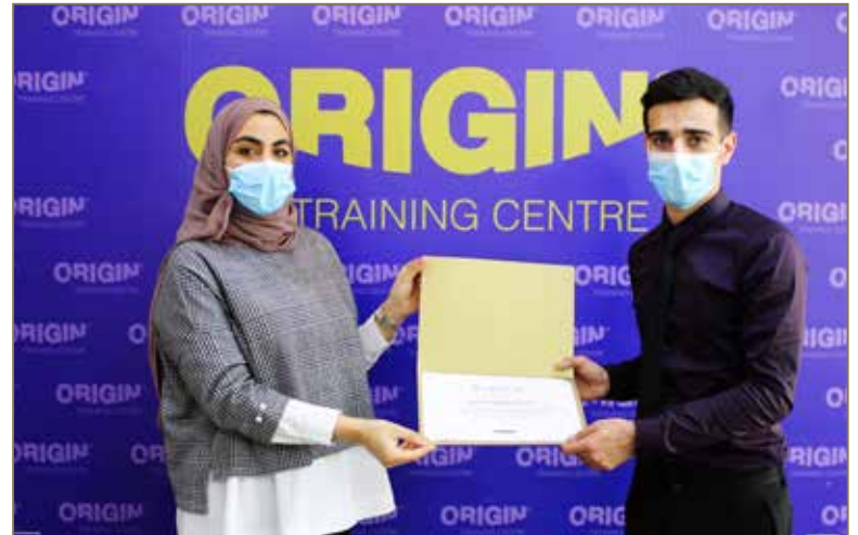
Honoring one of the Origin Training Centre trainees after his training completion