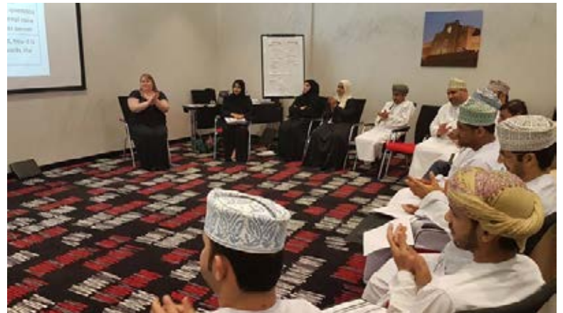
360 Degree Feedback Workshop in Suhar - Oman