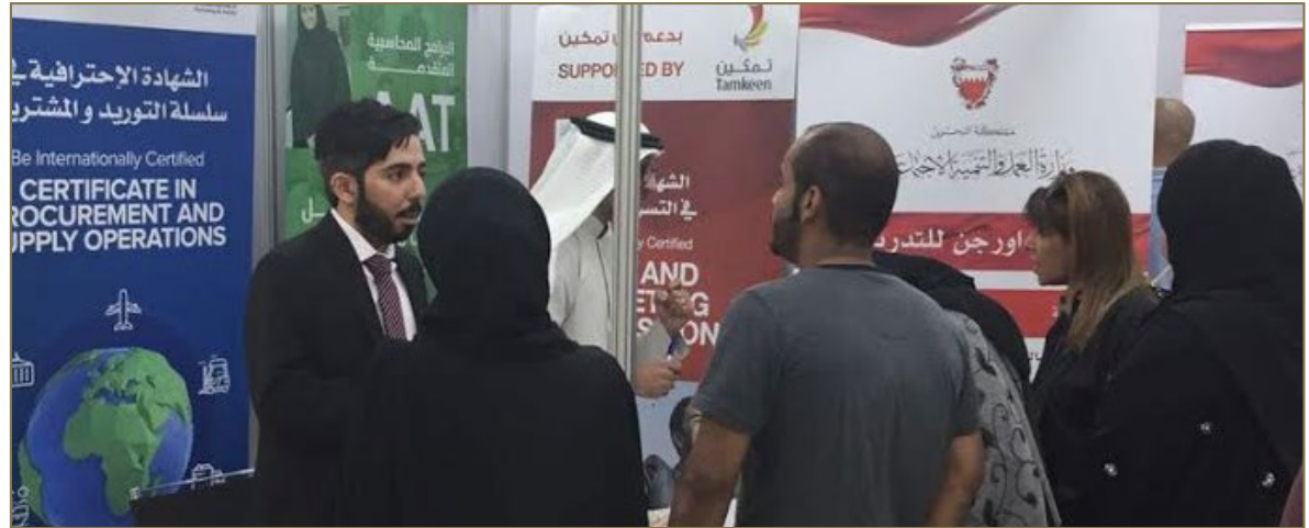
Job fair for administrative and supervisory professions

Origin Training Centre offers several training programs that target mainly Bahraini job seekers, varying from Basic