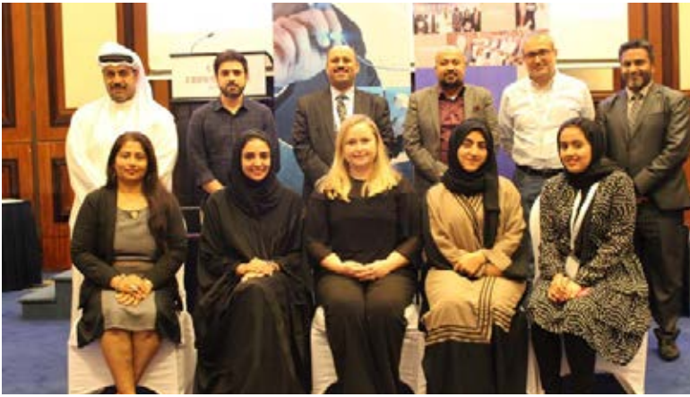
ورشة عمل "التقييم الشامل من خلال التغذية الراجعة ٣٦٠ درجة"