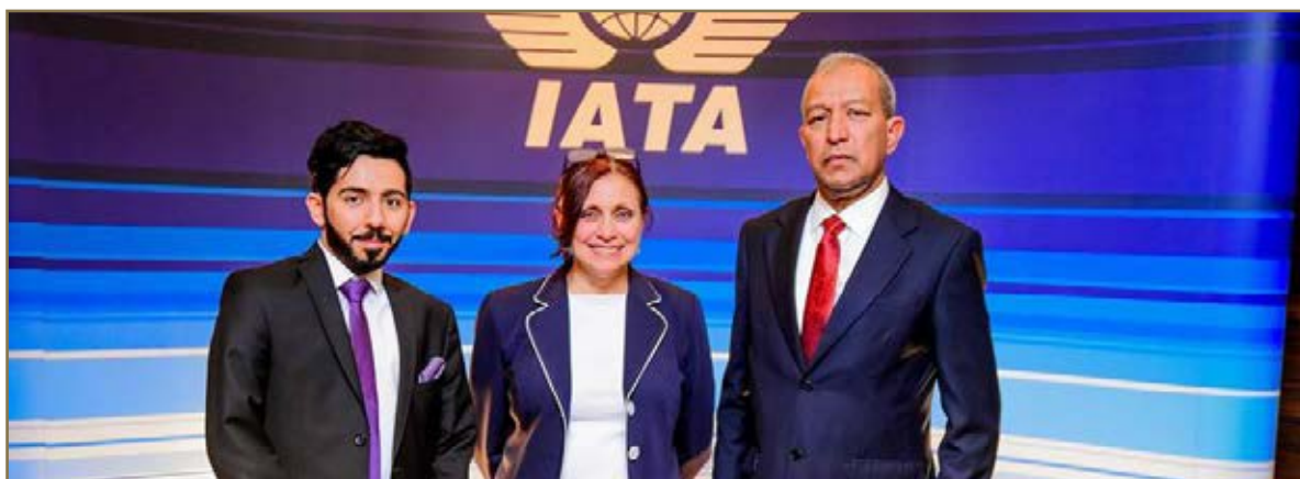
IATA Global Training Partners Conference 2017- group photo

platform to jointly discuss how we can work together more effectively, share best practices