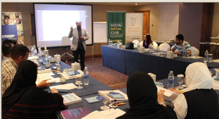
NISM "Social Media Strategist" class