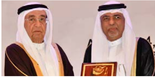
Deputy Prime Minister Recognizes Origin