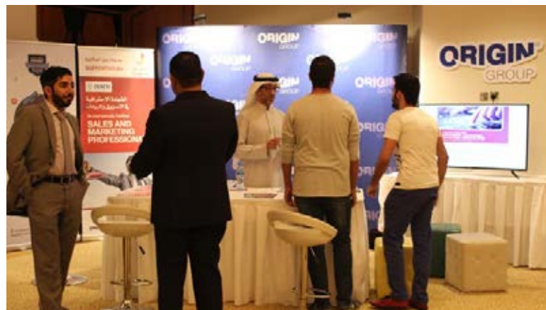
مشاركة مركز أوريجين للتدريب في معرض "فرستي" للوظائف