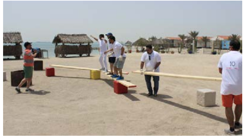
"Team Building Retreat" for Al Rashid Group