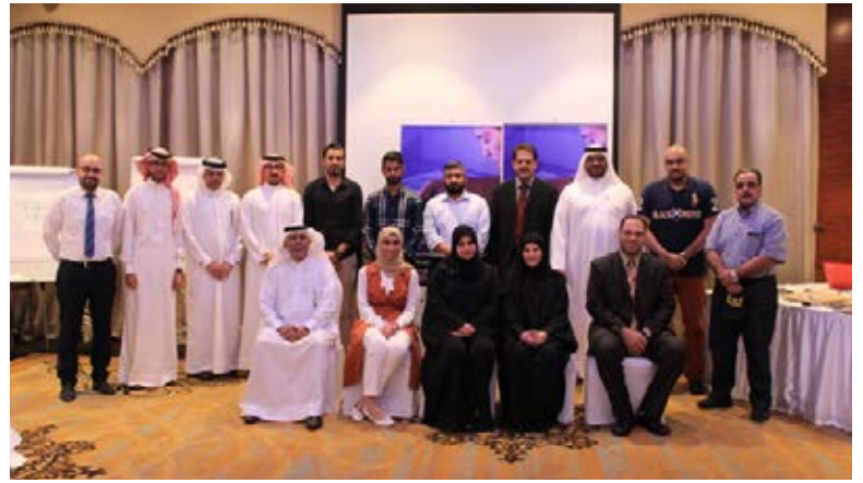
صورة من ورشة عمل "كشف التزوير والتزييف في المستندات والعملات الورقية" النقدية