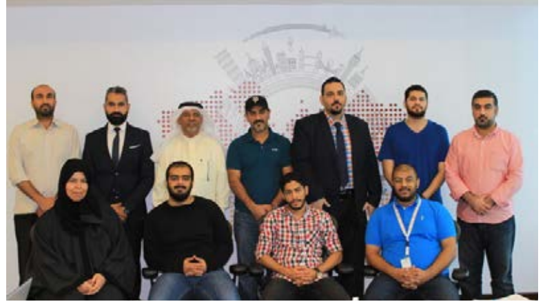
برنامج خدمة العملاء - المستوى ٢ لموظفي شركة Afro Asian Assistance