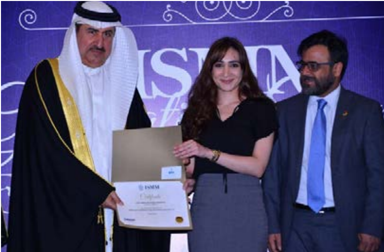
سعادة السيد صباح بن سالم الدوسري وكيل وزارة العمل والتنمية الاجتماعية لشئون العمل يكرم أحد الخريجات

وقد أقيم هذا الحفل بحضور كل من سعادة السيد صباح بن سالم الدوسري وكيل وزارة العمل والتنمية الاجتماعية لشئون العمل كضيف شرف، والسيد