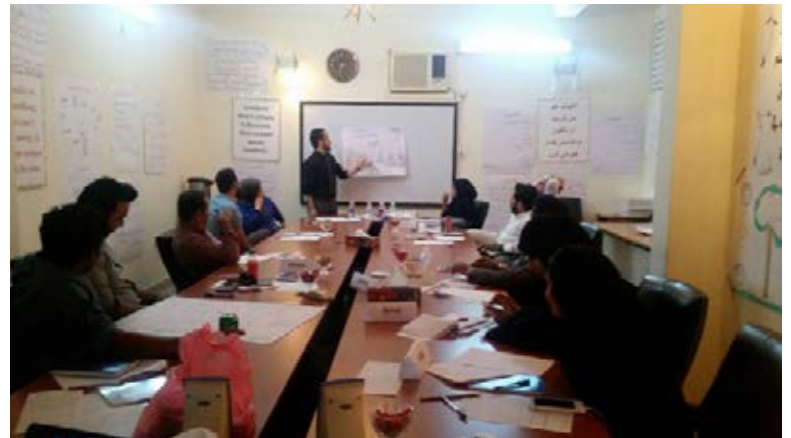
Origin staff attend a course in Project Management