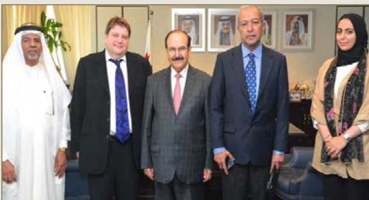
Minister of Water and Electricity Affairs receives the CEO of ISM and Origin Group's team.