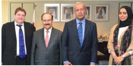
Minister of Electricity and Water Affairs Visit