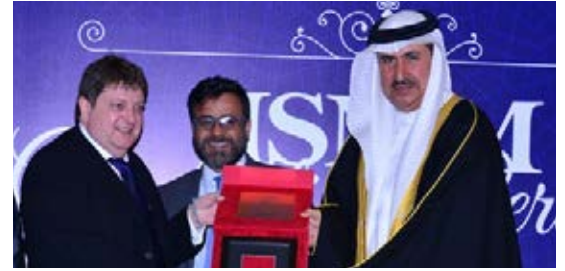
ISM Graduation Ceremony