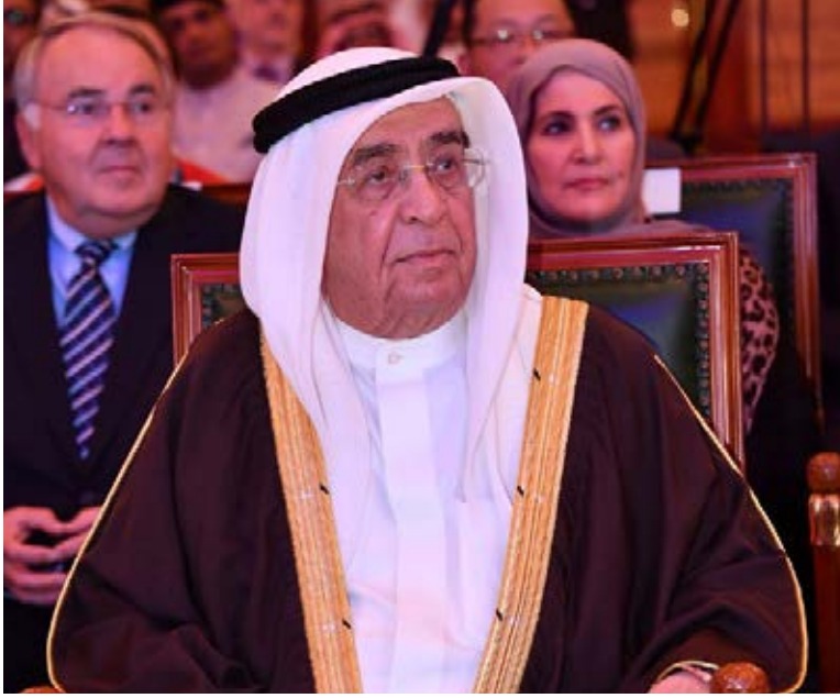
سمو الشيخ محمد بن مبارك آل خليفة، نائب رئيس مجلس الوزراء الموقر متراًساً افتتاح أعمال المؤتمر