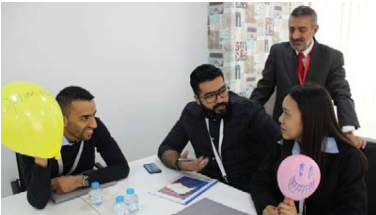
Customer Centricity Workshop