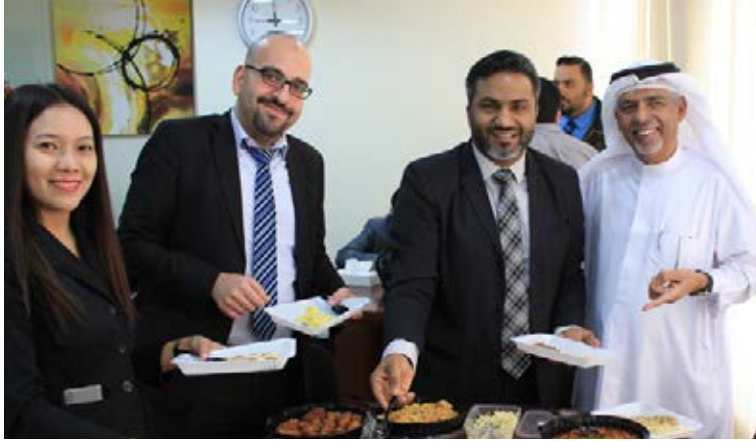
صورة تجمع الرئيس التنفيذي للمجموعة مع الموظفين في الإفطار الشهري