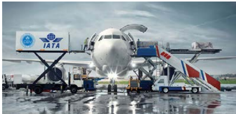
المنظمة العالمية للسفر والسياحة (IATA) الرائدة في السفر والسياحة

ويقدم مركز أوريجين للتدريب برنامج "الدبلوما في أساسيات السفر والسياحة" والذي يستهدف كافة العاملين في شركات ومكاتب الطيران والسياحة، الموظفين القائمين بمهام عمل الحجوزات للمسؤولين، والعاملين في مكاتب الحملات السياحية، بالإضافة إلى المرشدين السياحيين.