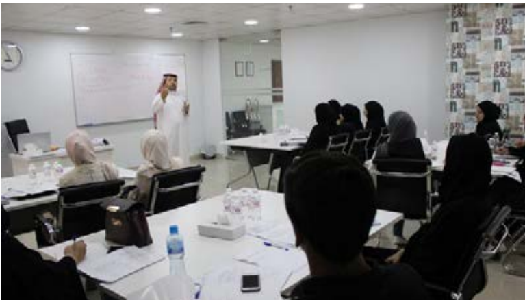
Class of AAT Level 1 Certificate in Accounting