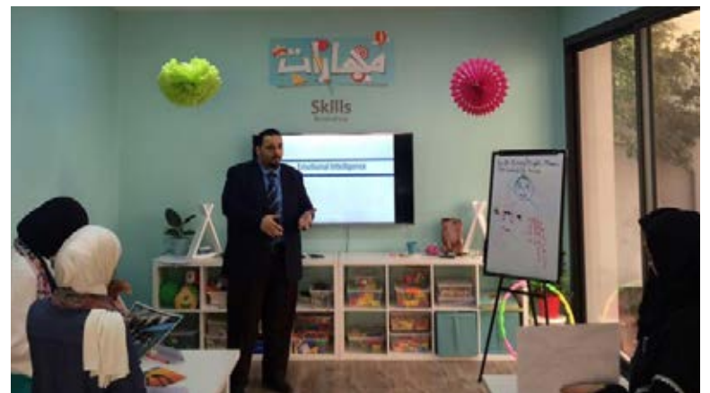
دورة "الذكاء العاطفي" لموظفات مكتبة "مهارات"