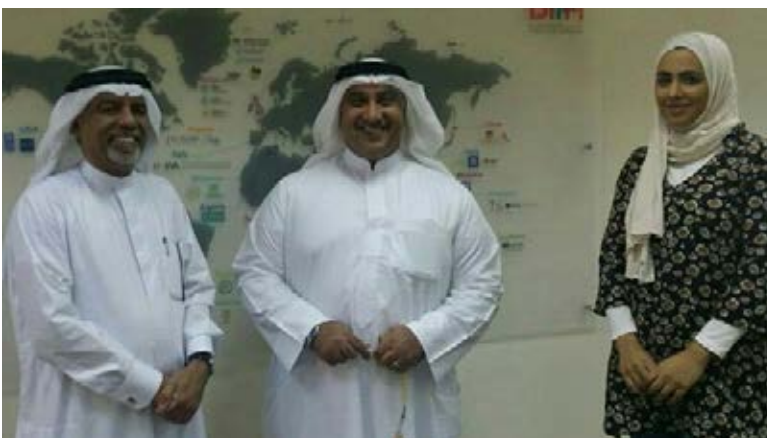
Origin Group visits the Institute of Public Administration