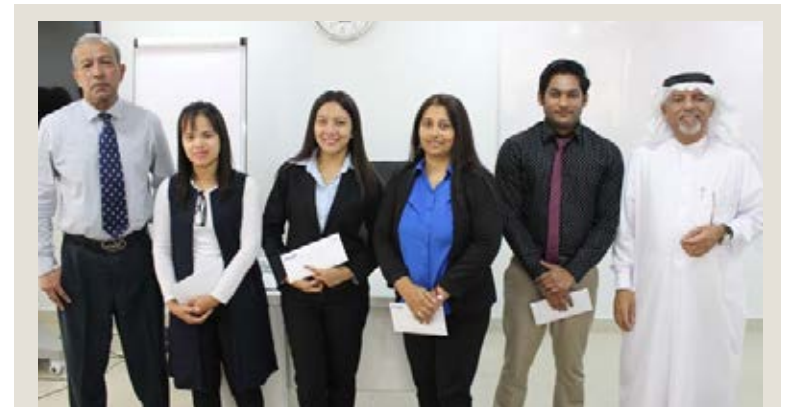
OTC management rewards the QQA team members

The CEO also awarded the members of the A team who worked on keeping documents of the training programs, trainees, and trainers in a proper sequence.