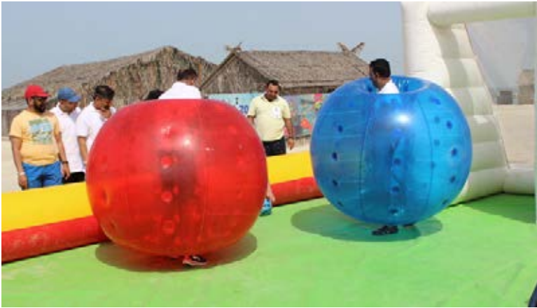
"Team Building Retreat" for Al Rashid Group