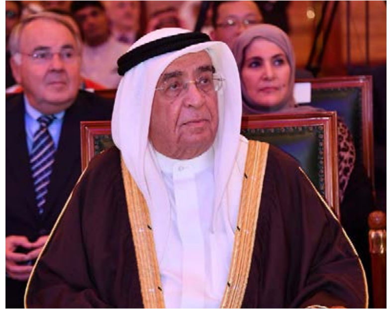
H.H. Sheikh Mohammed bin Mubarak Al Khalifa, Deputy Prime Minister Recognizing Origin Group for sponsorship

Last but not the least, I would like to thank the international awarding bodies for their sustainable support and cooperation with different bahraini educational and training institutions to reduce the gap between supply and demand in the labor market.