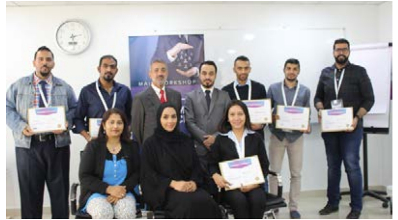
صورة جماعية لختام ورشة عمل "مركزية العميل"