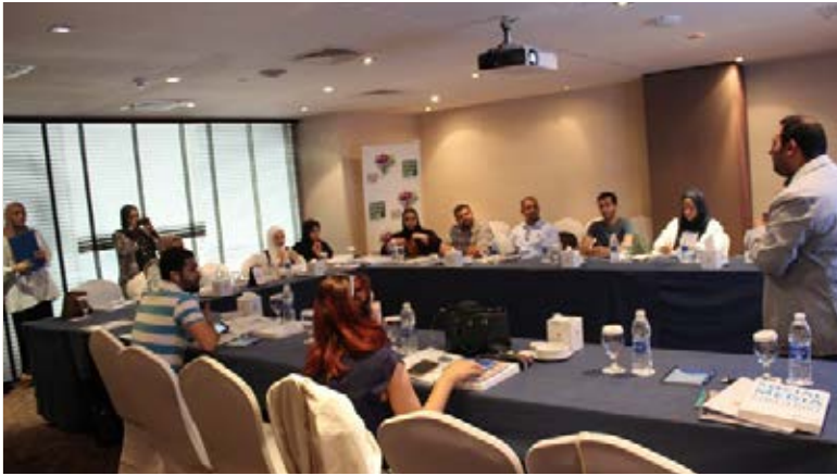
برنامج "الشهادة الاحترافية لاستراتيجيات الاعلام الاجتماعي"