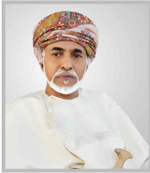
حضرة صاحب الجلالة السلطان قابوس بن سعيد المعظم سلطان عمان