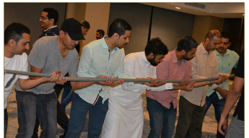
فعالية "مهارات بناء الفريق الواحد" لموظفي شركة اليوسف للصرافة