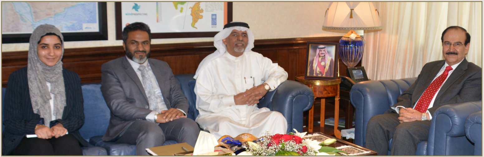
صورة لوفد أوريجين في ضيافة سعادة وزير شؤون الكهرباء والماء الدكتور عبدالحسين بن علي ميرزا الموقر

استقبل سعادة الدكتور عبدالحسين بن علي ميرزا وزير شؤون الكهرباء والماء بمكتبه وفداً من مجموعة أوريجين متمثلاً في كل من الدكتور أحمد البناء - الرئيس التنفيذي لمجموعة أوريجين وعدداً من أعضاء الإدارة التنفيذية في المجموعة. حيث تقدم الوفد بطلب رعاية سعادة الوزير لـ "مؤتمر تطوير الشؤون القانونية من خلال الابتكار وتكنولوجيا المعلومات في منطقة الشرق الأوسط وشمال إفريقيا" وذلك في الفترة من ٢٢-٢٣ يناير ٢٠١٩ في فندق الدبلوماسية راديسون بلو - مملكة البحرين. هذا وتفضل سعادة الوزير بالموافقة على رعاية الكريمة لهذا المؤتمر كما وأشاد بالجهود التي يبذلها أعضاء مجموعة أوريجين في سعيهم لنشر الثقافة والمعرفة والإسهام في رفع المستوى الفكري لدى الأفراد والمؤسسات داخل وخارج البحرين، معرباً عن بالغ سعادته وامتنيًا لهم المزيد من العطاء والانجاز في مثل هذه المجالات.