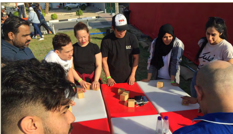
Ashraf Group "Team Building Retreat" In BIC