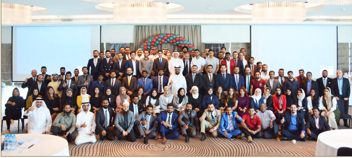
صورة جماعية لموظفي كلام تيليكوم وتواصل مع رئيس مجلس إدارة الشركة

نظمت مجموعة أوريجين فعالية (مهارات بناء الفريق الواحد) لموظفي شركة كلام تيليكوم - البحرين وشركة تواصل - الكويت، وذلك بعد استحواذ كلام تيليكوم على شركة تواصل مؤخراً. ولتعريف أفراد فريق شركة تواصل على باقي أفراد فريق كلام تيليكوم في البحرين، قررت الإدارة تنظيم فعالية ضخمة دعت فيها جميع موظفي الشركتان؛ للتواصل والتعارف وغرس روح الفريق الواحد.