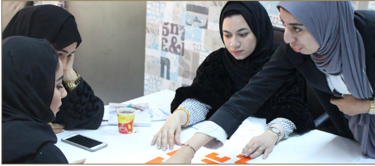
صور لمتدربي برنامج التسويق والمبيعات - المستوى الأول

أوريجين للتدريب، بالإضافة إلى عدة وظائف في قطاع تصميم الأزياء والتجميل.