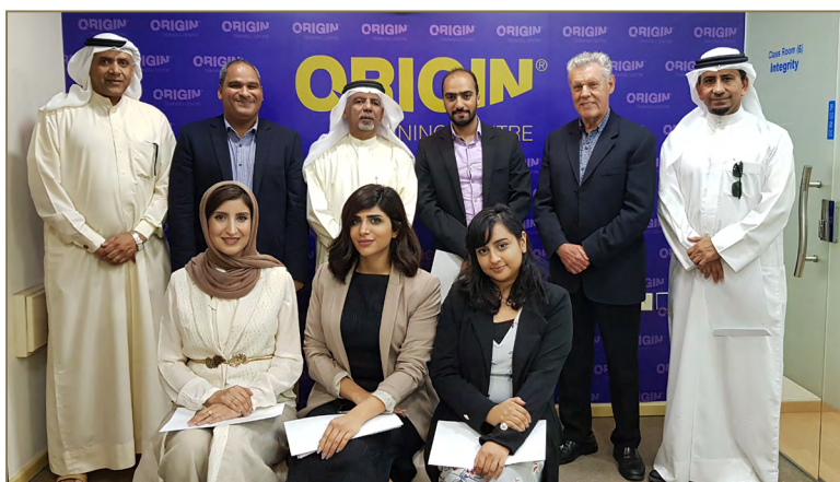
OTC Trainers at the end of TOT course