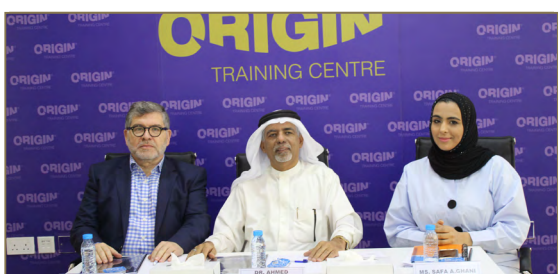
06 مؤتمر دولي في تكنولوجيا الشؤون القانونية