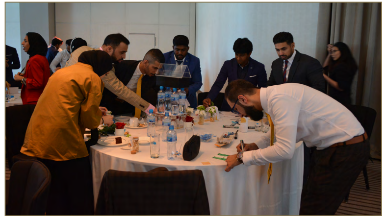
Team Building activities for "Kalam Telecom" and "Tawasul"