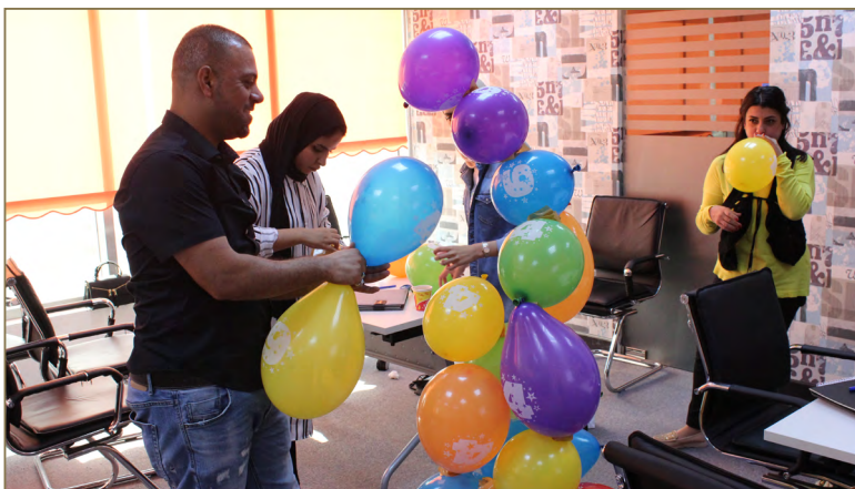
دورة "الإدارة المكتبية المتقدمة لموظفي تمكين"