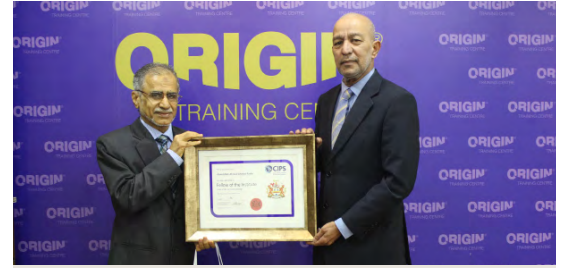
Recognition of Chartered Fellowship | 06

A Quarterly Newsletter Published by Origin Group - Kingdom Of Bahrain