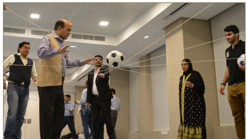
Al Hooty Analytics Employees during "Team building skills" Event