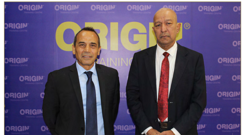
زيارة ممثل معهد المحاسبة الإدارية IMA - بريطانيا لمركز أوريجن للتدريب