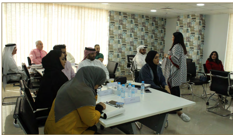
PR Professional course for "EWA" employees