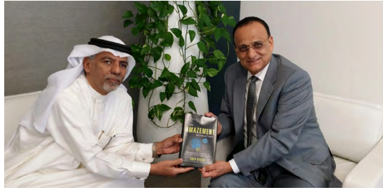
Where CEOs Meet | 05