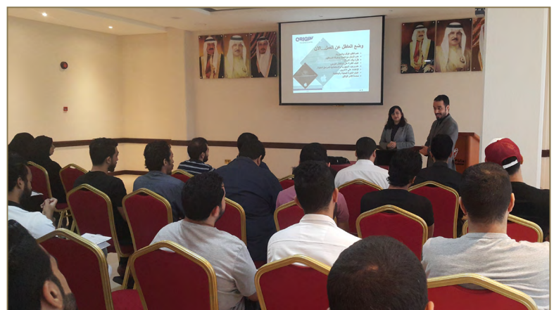
OTC meets a group of Job seekers at Ministry of Labor building