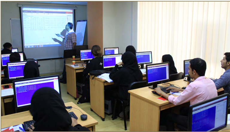
متدربو برنامج "إحصائي السياحة والسفر" خلال تطبيق برنامج Sabre