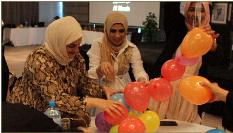
Team Building Activity During Al Nooh staff event