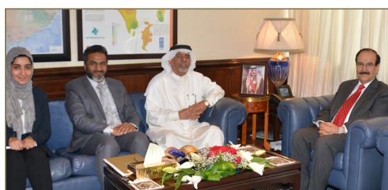
02 زيارة وزير شؤون الكهرباء والماء