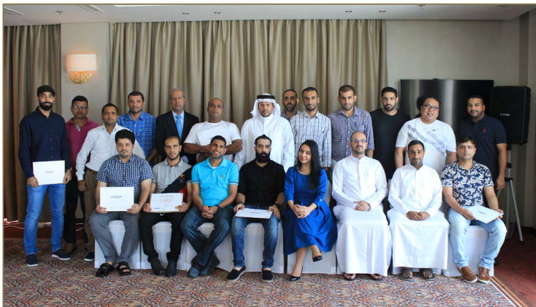
دورة التفكير الإبداعي لموظفي شركة فولاذ