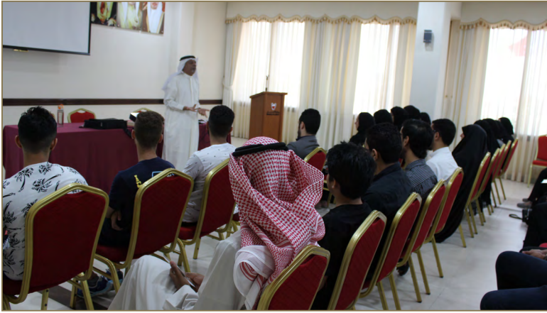
رئيس مركز أوريجن للتدريب يحاضر عدداً من الباحثين عن عمل في مبنى وزارة العمل والشؤون الاجتماعية