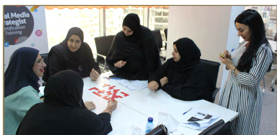
03 دعم الباحثين عن عمل بأفضل الفرص الوظيفية