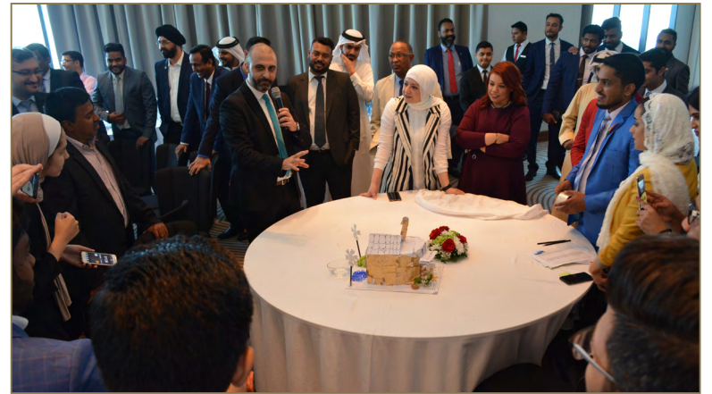
فعالية "الفريق الواحد" لموظفي كلام تيليكم وتواصل