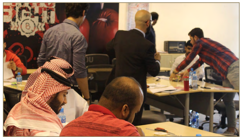
"Problem Solving Skills" course for Batelco employees