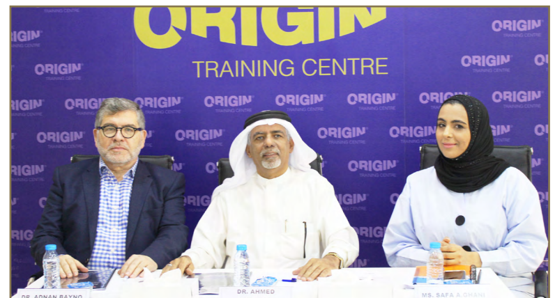
المؤتمر الصحفي المنعقد حول مؤتمر تطوير الشؤون القانونية

سيشكك البعض في أن التقدم في التقنيات الحديثة يمارس ضغطاً مطرداً على أولئك المنخرطين في المجال القانوني، ولكنه في الواقع على العكس تماماً سيعيد تشكيل