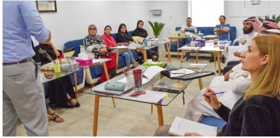
Kauffman FastTrac Entrepreneurship Programmes | 03