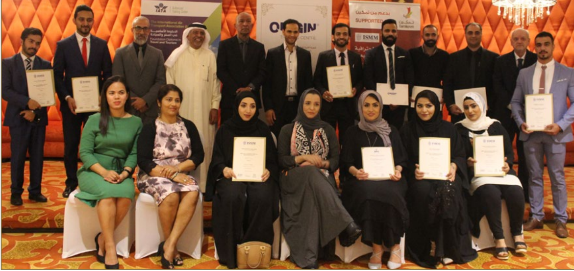
صورة جماعية لخريجي برنامج دبلوما التسويق والمبيعات.

احتفل مركز أوريجين للتدريب في أمسية بهيجة بفندق هاني رويال، بتكريم عدد من خريجي برنامج إدارة التسويق والمبيعات الممنوحة شهادته من معهد إدارة المبيعات ISM - بريطانيا، وذلك بحضور خريجي البرنامج وذوئهم ورؤسائهم في العمل بالإضافة إلى مجموعة من موظفي مركز أوريجين للتدريب.