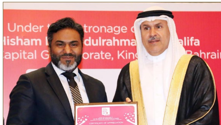
Social Media Club Rewards OTC for Its Social Media Initiatives