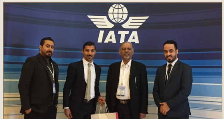
صور متفرقة من المؤتمر العالمي لشركاء التدريب للمنظمة الدولية للنقل الجوي والوفد المشارك - اسطنبول.

الذي جرى في احتفالية تخريج متدربي برنامج الدبلوما الأساسية في السياحة والسفر. وقد عُقد المؤتمر في الفترة من 16 إلى 18 أبريل الماضي بفندق كونراد - اسطنبول. حيث التقى وفد مركز أوريجين للتدريب مع عدد كبير من ممثلي مراكز التدريب المختلفة حول العالم التي تُنفذ برامج المنظمة الدولية للنقل الجوي IATA. وقد سلط المؤتمر الضوء على تأثير التكنولوجيا الحديثة على مجال السياحة والسفر وأحدث التطبيقات الرقمية والتكنولوجية في هذا المجال بالإضافة إلى رفع مستوى الإبداع والابتكار في مزاوئي ومدرسي هذا القطاع.