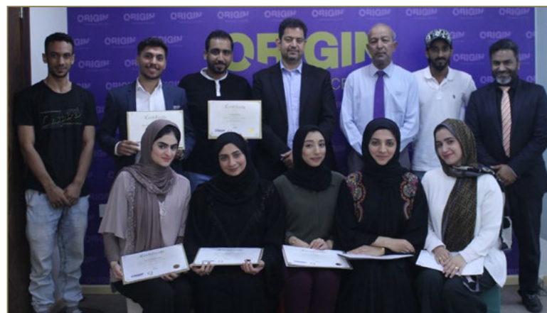
Time Management Course for MTQ employees