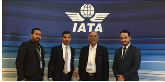
IATA Global Training Partners Conference | 08