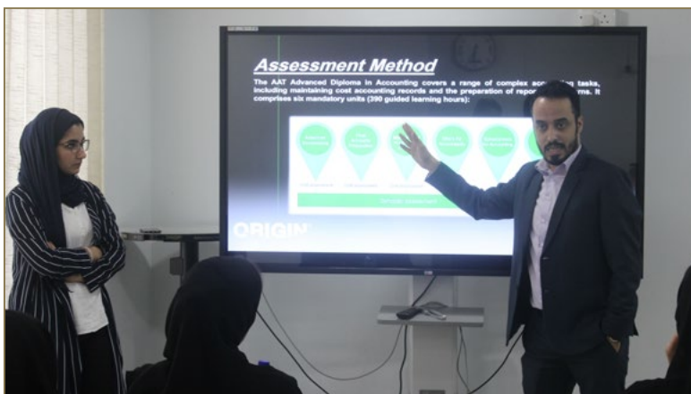
Orientation for New Trainees of AAT Program