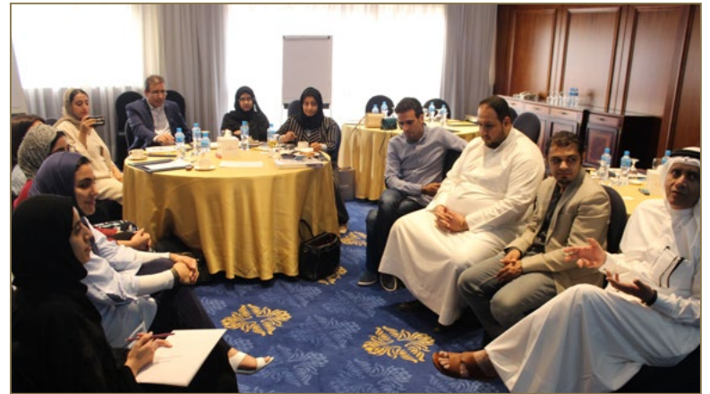
أحد التدريبات الجماعية خلال برنامج تدريب المدربين