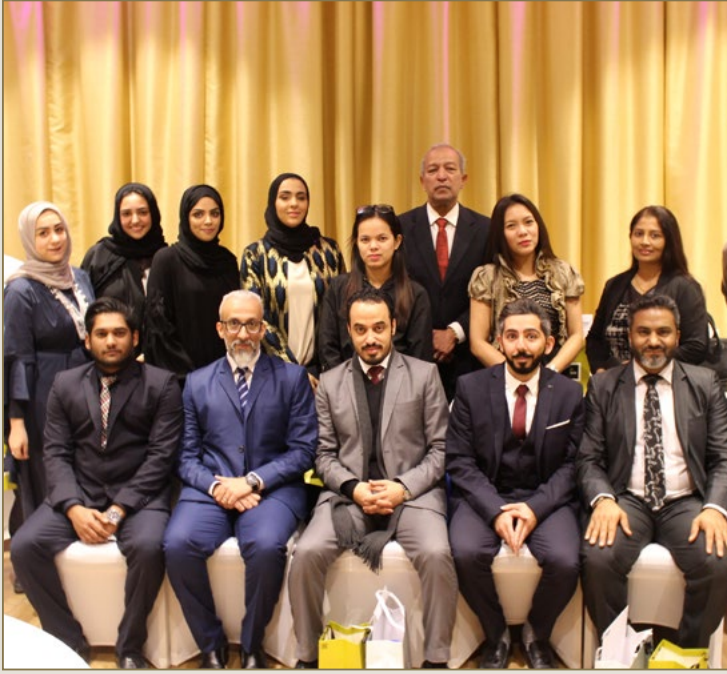
لقطة تذكارية لبعض موظفي أوريجين