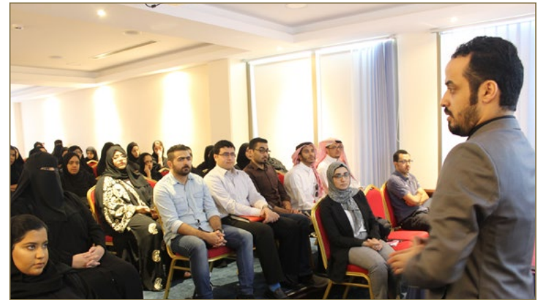
محاضرة تعريفية للباحثين عن عمل في مبنى وزارة العمل والتنمية الاجتماعية