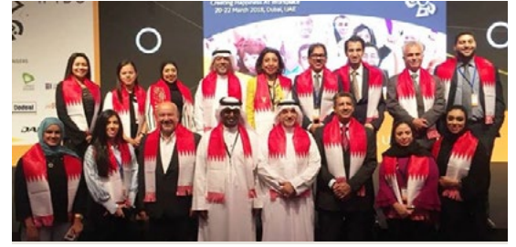
The 47th IFTDO Conference - DUBAI | 10

A Quarterly Newsletter Published by Origin Group - Kingdom Of Bahrain