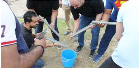
OTC Outrivalled in "Team Building" Course | 03