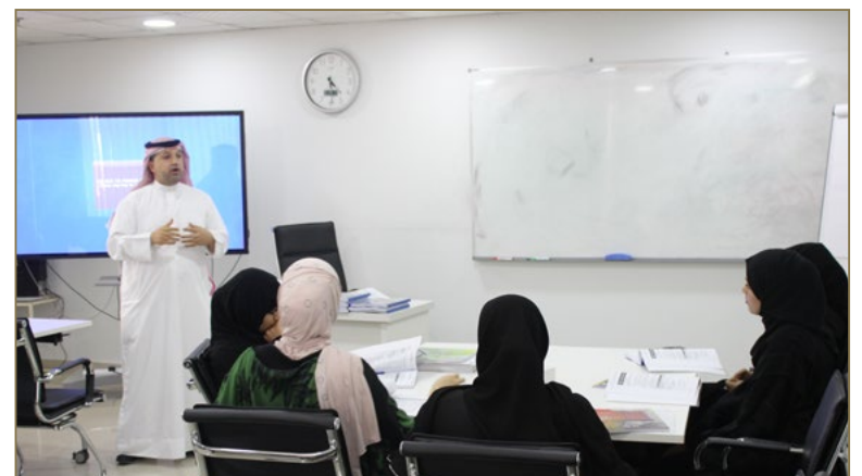
صورة لأحد دفعات برنامج الحاسبة المعتمد من منظمة فنيي الحاسبة ببريطانيا