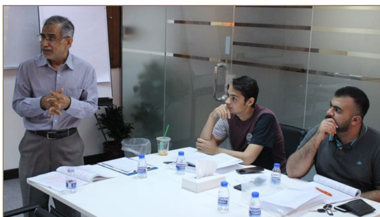
CIPS Training classroom