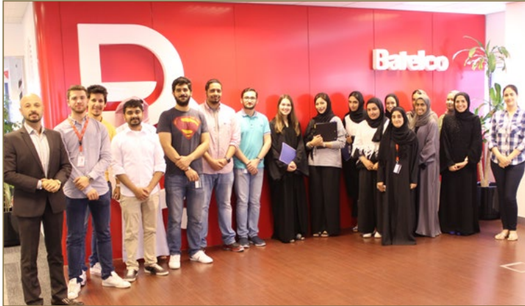
صورة جماعية لمتدربي شركة بتلكو في برنامج مهارات حل المشكلات