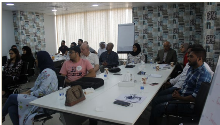
Origin Mid Year Performance Review