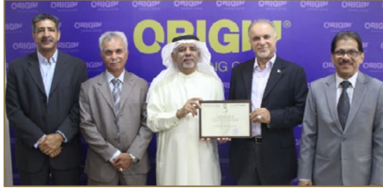
05 | تهنئة من جمعية البحرين للتدريب والتطوير