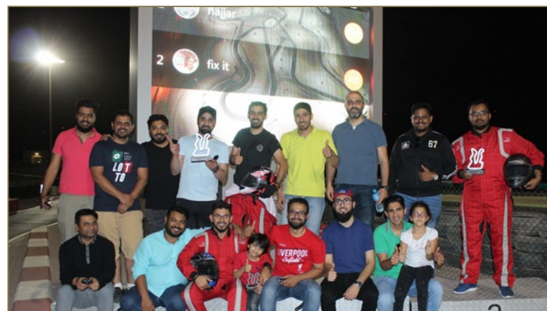
ختام فعاليات دورة مهارات بناء الفريق لشركة كلام تيليكون