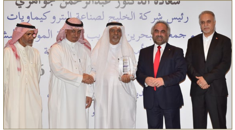
تكريم مجموعة أوريجين كأحد رعاة الفبة الرمضانية لجمعية البحرين للتدريب