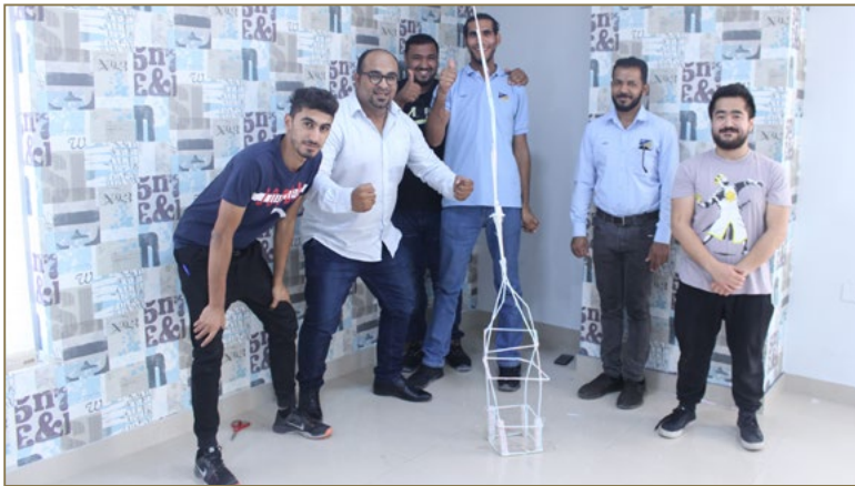
صورة لموظفي شركة الحوطي خلال دورة مهارات بناء الفريق