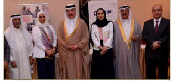
03 | معرض البحرين للتدريب والتعليم ما قبل العمل