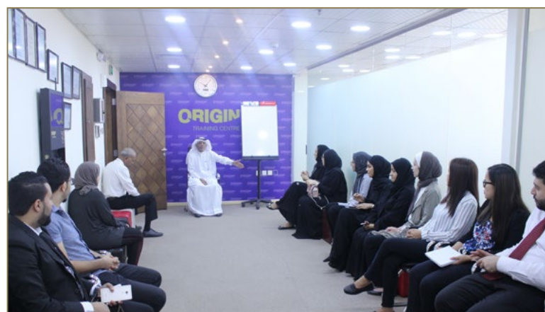
Origin Staff Monthly Breakfast