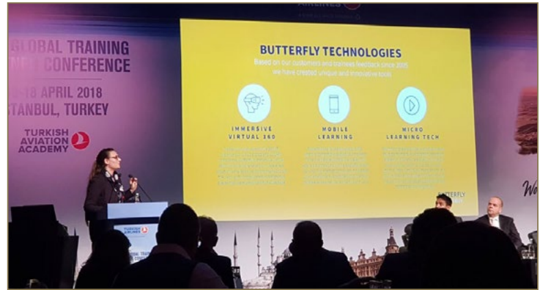
Snapshots of IATA Global Training Partners Conference 2018 in Istanbul