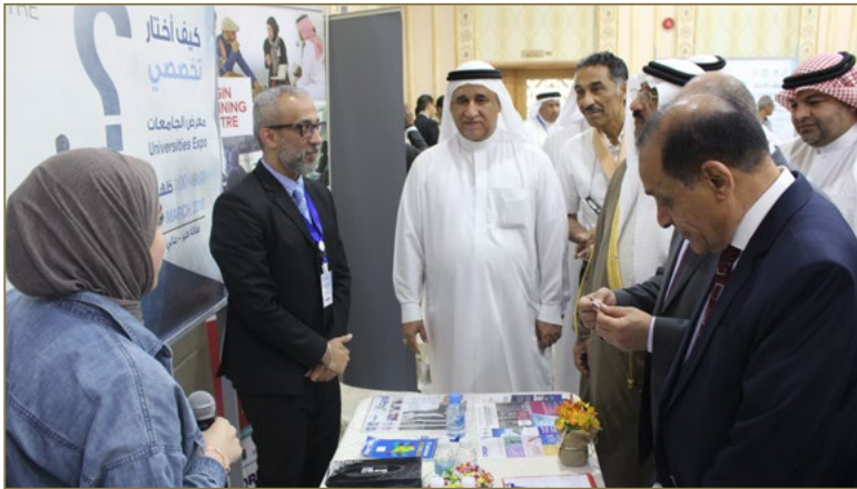
مشاركة مركز أوريجين للتدريب في معرض العمل الذي نظمته جمعية عالي الخيرية