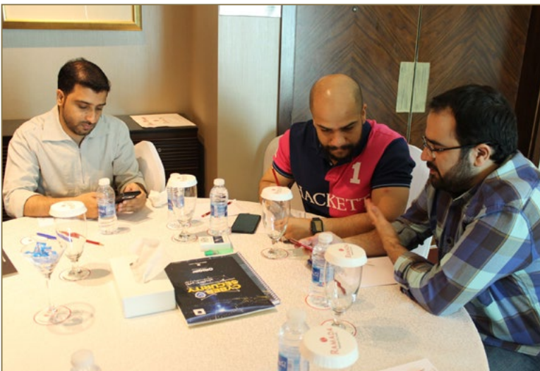
بعض المشاركين في الدورة خلال تأدية بعض التمارين الجماعية

وقد أدار الدورة التي استمرت لثلاثة أيام المتخصص ريتشارد بينغلي من بريطانيا وهو يمتلك سنوات طويلة من الخبرة في المجال.