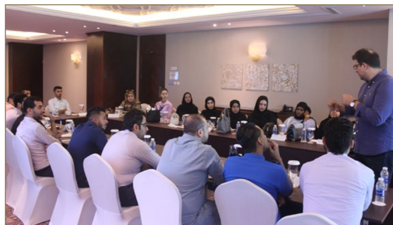
Communication Skills Course for Ansar Gallery and Al Hoty