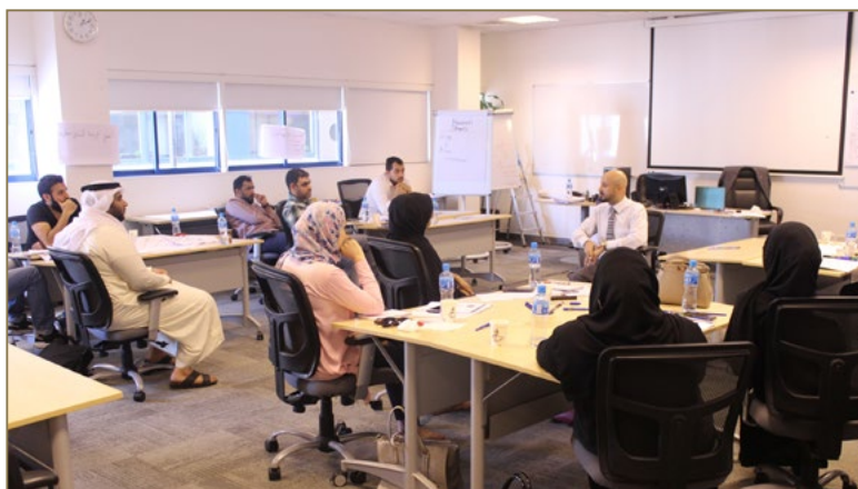
Negotiation Skills Course for Batelco