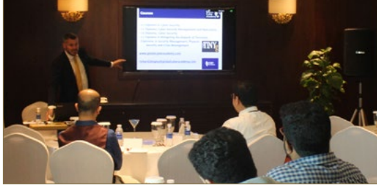
08 | دورة تدريبية في "الأمن السيبراني"